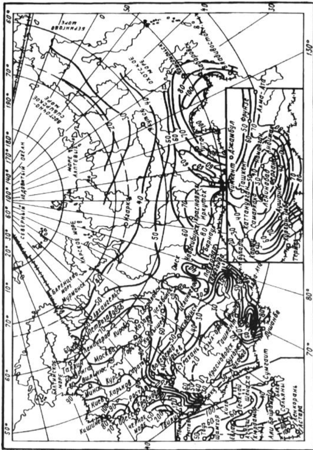
Чертеж 1. Значения величин интенсивности дождя Q_{20}